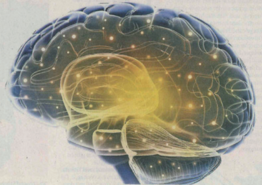
Rund 10.000 Menschen haben bereits einen implantierten Hirnschrittmacher, der Symptome schwerer Erkrankungen bekämpft. Er sendet gezielte Impulse.

Nehmen wir an, ein Patient hat einen Hirnschrittmacher. Die Behandlung läuft gut, aber die Nebenwirkungen lassen ihn aggressiv werden. Er wird schließlich straffällig. Darf dieses Risiko eingegangen werden? Und wer trägt es? Es gibt viele Fragen, die meisten bleiben unbeantwortet. Der Vortrag war weniger