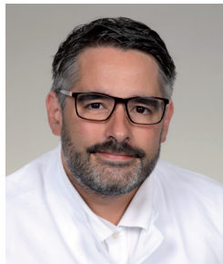
Hauptoperateur des EPZ