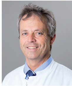
Hauptoperateur des EPZ

Telefon 02161/892 4201 Telefax 02161/892 4202 E-Mail: unfallchirurgie@mariahilf.de